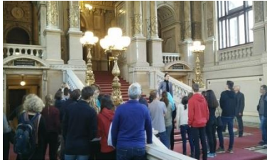
Besuch des Wiener Burgtheaters

Die Aktion Knochenmarkspende Bayern durfte sich im September über eine Spende in Höhe von 1000 Euro freuen. Diese Summe konnte durch das musikalische Engagement unserer Schülerinnen und Schüler beim Sommerkonzert gewonnen werden. Vielen Dank an alle Beteiligten, welche die lebenswichtige Arbeit der AKB unterstützen.