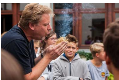
Feuermachen auf Steinzeitart

Die dritte Schulwoche wurde – wie in den Vorjahren bewährt – als „besondere Woche“ organisiert. Die 10. Klassen absolvierten in diesen Tagen ihre Lehr- und Studienfahrten nach Berlin bzw. Wien und die 9. Jahrgangsstufe durfte im Betriebspraktikum etwas Arbeitsluft schnuppern.