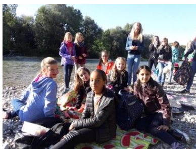
Schülerinnen der Klasse 5b beim Picknick an der Isar

Sehr geehrte Erziehungsberechtigte, zukünftig erhalten Sie in regelmäßiger Abfolge „Schullebenszeichen“, unsere neue digitale Informationsschrift für Eltern. Wir möchten Ihnen damit einen Einblick in unser vielfältiges Schulleben geben.