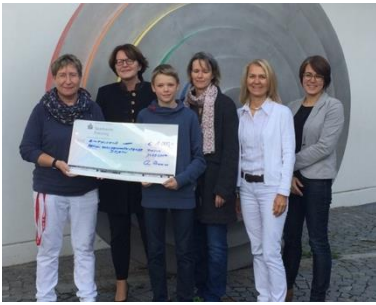
Spendenübergabe an die AKB